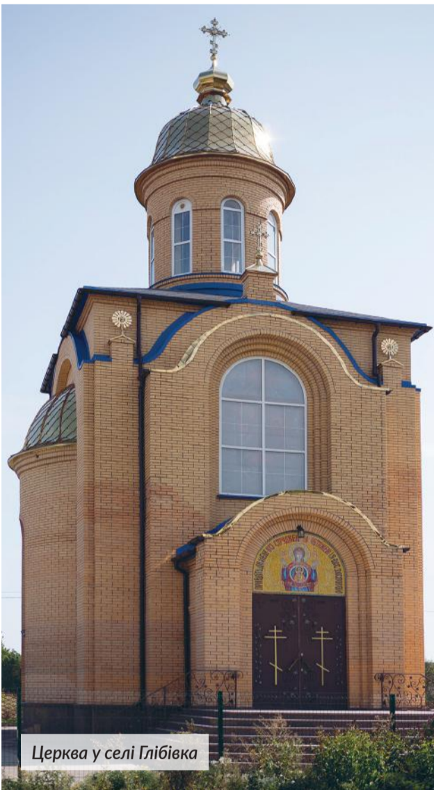
Церква у селі Глібівка

КАНДИДАТ НА ПОСАДУ ДИМЕРСЬКОГО СЕЛИЩНОГО ГОЛОВИ