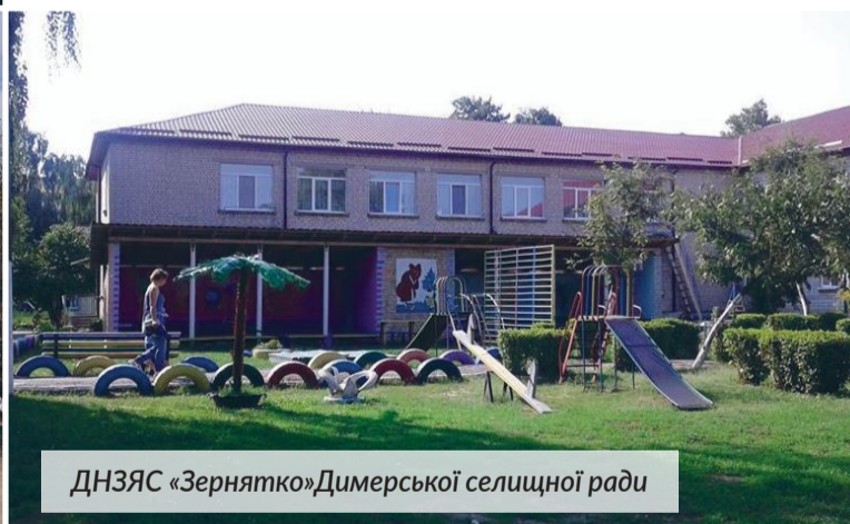
ДНЗЯС «Зернятко» Димерської селищної ради