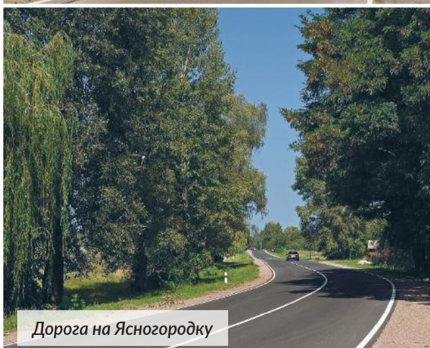
Дорога на Ясногородку