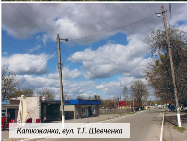
Катюжанка, вул. Т.Г. Шевченка